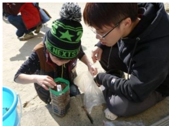
タネまき（坂元小学校）2013年11月16日

※ 集合・解散の場所は坂元小学校。保護者の皆様には、お子さまの登下校の送り迎えをお願いいたします。