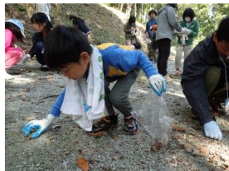
タネ集め（深山山麓少年の森）2014年10月26日